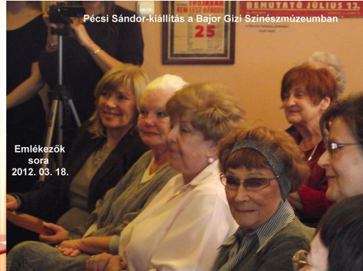
Pécsi Sándor-kiállítás a Bajor Gizi Színházmúzeumban