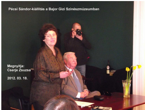
Pécsi Sándor-kiállítás a Bajor Gizi Színházmúzeumban