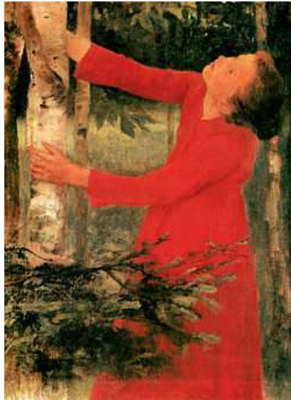
Madárdal című festmény

Nyitva: 2011. november 30 – 2012. május 27.