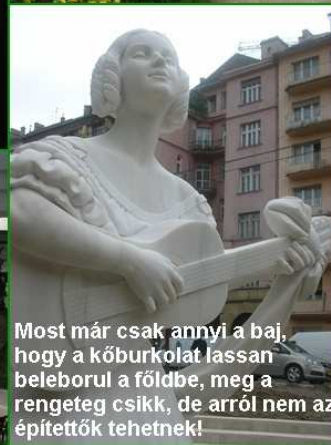
Most már csak annyi a baj, hogy a kőburkolat lassan beleborul a földbe, meg a rengeteg csikk, de arról nem az építettek tehetnek!