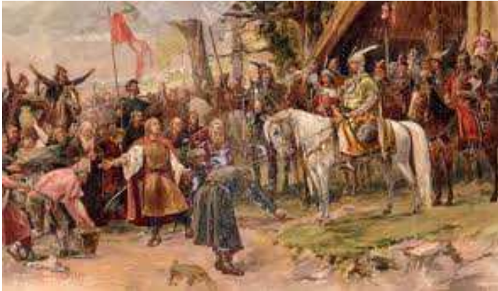
Munkácsy: Honfoglalás (Parlamentből)

Nyitva: 2012. január 3 - 2012. augusztus 26.