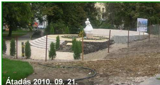
Átadás 2010. 09. 21.