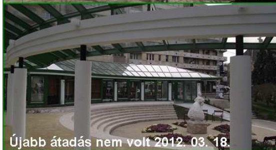
Újabb átadás nem volt 2012. 03. 18.

A Színházmúzeumból hazafelé jövet elhaladtunk a Déryné szobor előtt. Újra lefotóztam és most közzé teszem, mert nagy változásai vannak. Ha még emlékeztek korábban már egyszer átadták a szobrot, (akkor beszámoltam róla) azaz felavatták, olyan állapotban, amikor még egyáltalán nem volt készen. Talán most már készen van, de újabb átadás nem volt, vagy én nem